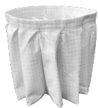
ANT M Filtro antistatico (Classe M EN 60335-2-69)