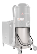
BX Contenitore in acciaio INOX AISI 304