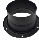
P12300/180 FLANGIA CONNESSIONE FLESSIBILE Ø 180MM Flangia di accoppiamento su aspiratore industriale DF per tubo flessibile diametro 180 mm