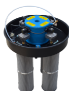
SP Pulizia cartucce in controcorrente d'aria Filtro antistatico classe M (EN 60335-2-69) 4 Filtri poliestere antistatici 12 m 2 superficie filtrante