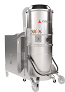
TX Contenitore camera e struttura in acciaio INOX AISI 304