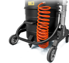
KDP KIT differenziale di pressione per insaccamento