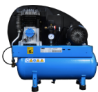
COM Compressore a bordo Compressore montato su carenatura posteriore