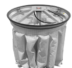
PSC Scuotifiltro Pneumatico