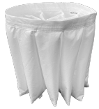
PTFE Filtro PTFE (Classe M EN 60335-2-69)