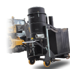
FKL Supporto sollevamento per muletto