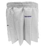
PTFE ANT Filtro PTFE antistatico (Classe M EN 60335-2-69)