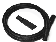
P13638 STARTER KIT Ø 40MM Kit base di accessori specifici per aspirazione solidi e liquidi in diametro 40 mm