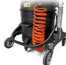
KDP KIT differenziale di pressione per insaccamento