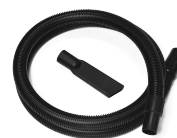
P13638 STARTER KIT Ø 40MM Kit base di accessori specifici per aspirazione solidi e liquidi in diametro 40 mm