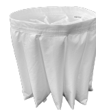
PTFE Filtro PTFE (Classe M EN 60335-2-69)