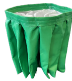
MTF Filtro teflonato (Classe M EN 60335-2-69)