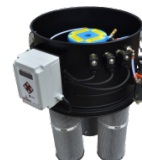
SP Pulizia cartucce in controcorrente d'aria Filtro antistatico classe M (EN 60335-2-69) 3 Cartucce poliestere antistatico 9 m 2 superficie filtrante