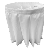
PTFE Filtro PTFE (Classe M EN 60335-2-69)