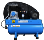
COM Compressore a bordo Compressore montato su carenatura posteriore