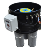
SP Pulizia cartucce in controcorrente d'aria Filtro antistatico classe M (EN 60335-2-69) 3 Carucce poliestere antistatico 9 m 2 superficie filtrante