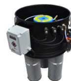
SP Pulizia cartucce in controcorrente d'aria Filtro antistatico classe M (EN 60335-2-69) 3 Cartucce poliestere antistatico 9 m 2 superficie filtrante