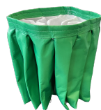
MTF Filtro teflonato (Classe M EN 60335-2-69)