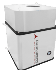
PRE H Pre-Cartuccia