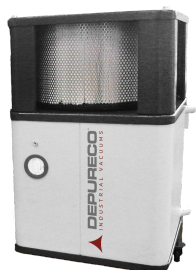
POST H Post-Cartuccia