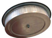
HEPA 14 Filtro assoluto (EN 1822-5)