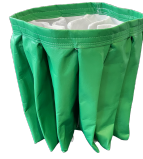
MTF Filtro teflonato (Classe M EN 60335-2-69)