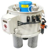
SP Pulizia cartucce in controcorrente d'aria Filtro antistatico classe M (EN 60335-2-69) 3 cartucce poliestere antistatico 9 m 2 superficie filtrante