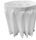
PTFE Filtro PTFE (Classe M EN 60335-2-69)