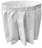
ANT M Filtro antistatico (Classe M EN 60335-2-69)