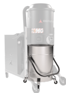
BX Contenitore in acciaio INOX AISI 304