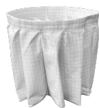
ANT M Filtro antistatico (Classe M EN 60335-2-69)