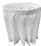
BFL Filtro classe M 38.000 cm 2