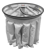
PSC Scuotifiltro Pneumatico