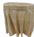
NOMEX Filtro resistente 250° Celsius