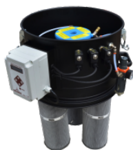
SP Pulizia cartucce in controcorrente d'aria Filtro antistatico classe M (EN 60335-2-69) 3 Cartucce poliestere antistatico 9 m 2 superficie filtrante