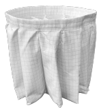
ANT M Filtro antistatico (Classe M EN 60335-2-69)