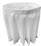
BFL Filtro classe M 38.000 cm 2