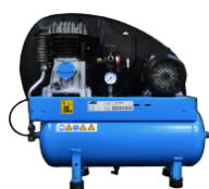
COM Compressore a bordo Compressore montato su carenatura posteriore