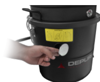
JC Jet Clean Pulizia semiautomatica a contro corrente d'aria, classe M filtro (EN 60335-2-69), 1 filtro cartuccia poliestere, 4 m 2 superficie filtrante, ghigliottina non inclusa