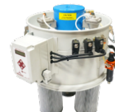
SP Pulizia cartucce in controcorrente d'aria Filtro antistatico classe M (EN 60335-2-69) 3 cartucce poliestere antistatico 9 m 2 superficie filtrante