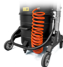
KDP KIT differenziale di pressione per insaccamento