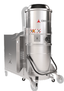
TX Contentitore camera e struttura in acciaio INOX AISI 304