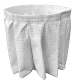
ANT M Filtro antistatico (Classe M EN 60335-2-69)