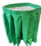
MTF Filtro teflonato (Classe M EN 60335-2-69)