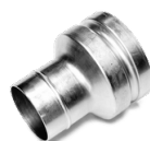
PO0278 TERMINALE IN ACCIAIO Ø 80/50MM Riduzione per innesto rapido aspiratore in acciaio zincato diametro 80/50 mm