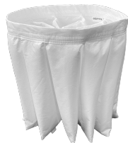
PTFE Filtro PTFE (Classe M EN 60335-2-69)