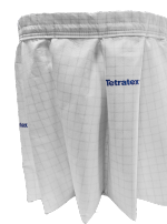
PTFE ANT Filtro PTFE antistatico (Classe M EN 60335-2-69)