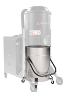
BX Contenitore in acciaio INOX AISI 304