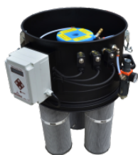
SP Pulizia cartucce in controcorrente d'aria Filtro antistatico classe M (EN 60335-2-69) 3 Cartucce poliestere antistatico 9 m 2 superficie filtrante