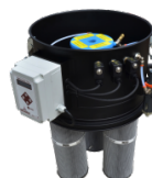
SP Pulizia cartucce in controcorrente d'aria Filtro antistatico classe M (EN 60335-2-69) 3 Cartucce poliestere antistatico 9 m² superficie filtrante