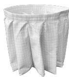
ANT M Filtro antistatico (Classe M EN 60335-2-69)