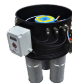
SP Pulizia cartucce in controcorrente d'aria Filtro antistatico classe M (EN 60335-2-69) 3 Cartucce poliestere antistatico 9 m 2 superficie filtrante