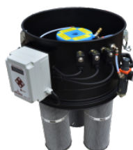
SP Pulizia cartucce in controcorrente d'aria Filtro antistatico classe M (EN 60335-2-69) 3 Cartucce poliestere antistatico 9 m 2 superficie filtrante