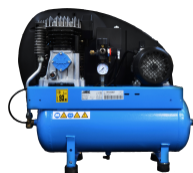
COM Compressore a bordo Compressore montato su carenatura posteriore