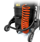
KDP KIT differenziale di pressione per insaccamento