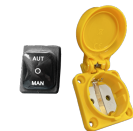
RC SCHUKO Controllo remoto da elettroutensile (MAX 2000 W)