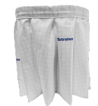
PTFE ANT Filtro PTFE antistatico (Classe M EN 60335-2-69)