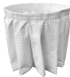
ANT M Filtro antistatico (Classe M EN 60335-2-69)