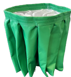
MTF Filtro teflonato (Classe M EN 60335-2-69)