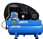
COM Compressore a bordo Compressore montato su carenatura posteriore