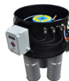
SP Pulizia cartucce in controcorrente d'aria Filtro antistatico classe M (EN 60335-2-69) 3 Cartucce poliestere antistatico 9 m 2 superficie filtrante