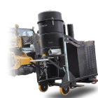
FKL Supporto sollevamento per muletto