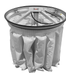
PSC Scuotifiltro Pneumatico