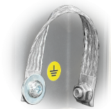
GRD Messa a terra