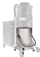
BX Contenitore in acciaio INOX AISI 304