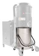
BX Contenitore in acciaio INOX AISI 304