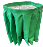
MTF Filtro teflonato (Classe M EN 60335-2-69)