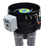
SP Pulizia cartucce in controcorrente d'aria Filtro antistatico classe M (EN 60335-2-69) 3 Cartucce poliestere antistatico 9 m 2 superficie filtrante