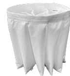
PTFE Filtro PTFE (Classe M EN 60335-2-69)