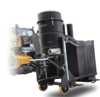
FKL Supporto sollevamento per muletto