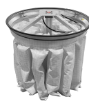
PSC Scuotifiltro Pneumatico