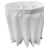
PTFE Filtro PTFE (Classe M EN 60335-2-69)