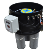
SP Pulizia cartucce in controcorrente d'aria Filtro antistatico classe M (EN 60335-2-69) 3 Cartucce poliestere antistatico 9 m 2 superficie filtrante