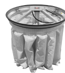
PSC Scuotifiltro Pneumatico