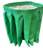
MTF Filtro teflonato (Classe M EN 60335-2-69)