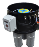
SP Pulizia cartucce in controcorrente d'aria Filtro antistatico classe M (EN 60335-2-69) 3 Cartucce poliestere antistatico 9 m 2 superficie filtrante