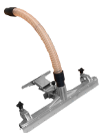
P00327 SPAZZOLA FISSA WET & DRY Ø 50MM Accessorio fisso wet & dry con connessione a tubo flessibile D50 mm