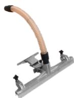
P00327 SPAZZOLA FISSA WET & DRY Ø 50MM Accessorio fisso wet & dry con connessione a tubo flessibile D50 mm