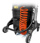
KDP KIT differenziale di pressione per insaccamento