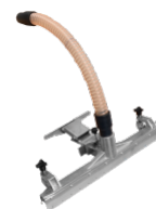
P00327 SPAZZOLA FISSA WET & DRY Ø 50MM Accessorio fisso wet & dry con connessione a tubo flessibile D50 mm