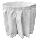
ANT M Filtro antistatico (Classe M EN 60335-2-69)