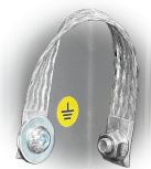
GRD Messa a terra