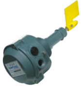
P10166 SENSORE DI LIVELLO ROTATIVO Sensore motorizzato in bassa tensione 24V con paletta rotante, certificato ATEX Z21