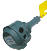
P10166 SENSORE DI LIVELLO ROTATIVO Sensore motorizzato in bassa tensione 24V con paletta rotante, certificato ATEX Z21