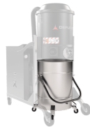
BX Contenitore in acciaio INOX AISI 304