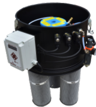
SP Pulizia cartucce in controcorrente d'aria Filtro antistatico classe M (EN 60335-2-69) 3 Cartucce poliestere antistatico 9 m 2 superficie filtrante