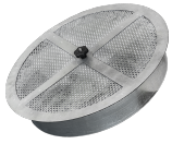
ACB Filtro carboni attivi