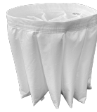
BFL Filtro classe M 38.000 cm 2