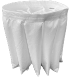
PTFE Filtro PTFE (Classe M EN 60335-2-69)