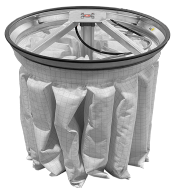
PSC Scuotifiltro Pneumatico