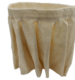
NOMEX Filtro resistente 250° Celsius