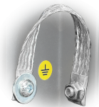
GRD Messa a terra