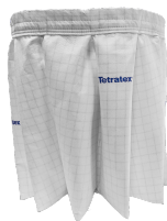
PTFE ANT Filtro PTFE antistatico (Classe M EN 60335-2-69)