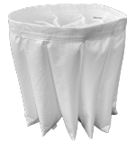
PTFE Filtro PTFE (Classe M EN 60335-2-69)