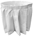
ANT M Filtro antistatico (Classe M EN 60335-2-69)