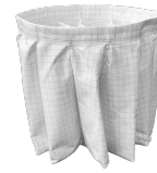
ANT M Filtro antistatico (Classe M EN 60335-2-69)