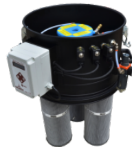
SP Pulizia cartucce in controcorrente d'aria Filtro antistatico classe M (EN 60335-2-69) 3 Cartucce poliestere antistatico 9 m 2 superficie filtrante