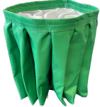
MTF Filtro teflonato (Classe M EN 60335-2-69)