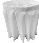
PTFE Filtro PTFE (Classe M EN 60335-2-69)