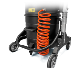
KDP KIT differenziale di pressione per insaccamento