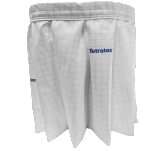
PTFE ANT Filtro PTFE antistatico (Classe M EN 60335-2-69)