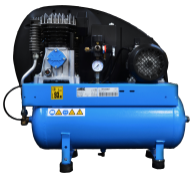
COM Compressore a bordo Compressore montato su carenatura posteriore