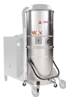
GX Camera e contenitore acciaio INOX AISI 304