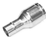
P10867 TERMINALE IN ACCIAIO Ø 70/40MM Riduzione per innesto rapido aspiratore in acciaio zincato diametro 70/40 mm