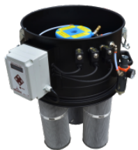
SP Pulizia cartucce in controcorrente d'aria Filtro antistatico classe M (EN 60335-2-69) 3 Cartucce poliestere antistatico 9 m 2 superficie filtrante