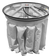
PSC Scuotifiltro Pneumatico