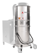
GX Camera e contenitore acciaio INOX AISI 304