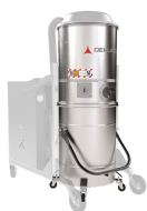
GX Camera e contenitore acciaio INOX AISI 304