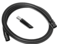
P12378 STARTER KIT ANTISTATICO Ø 50MM Kit base di accessori antistatici per applicazione con aspiratore ATEX in diametro 50 mm