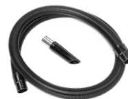
P12378 STARTER KIT ANTISTATICO Ø 50MM Kit base di accessori antistatici per applicazione con aspiratore ATEX in diametro 50 mm