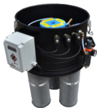
SP Pulizia cartucce in controcorrente d'aria Filtro antistatico classe M (EN 60335-2-69) 3 Cartucce poliestere antistatico 9 m 2 superficie filtrante