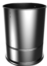
COSTRUZIONE IN ACCIAIO Robusta costruzione in acciaio verniciato industriale