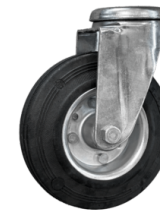
RUOTE Ruote antitraccia pivotanti