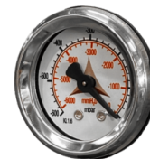
VUOTOMETRO Vuotometro per segnalazione di filtro ostruito o da sostituire