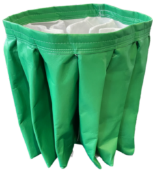
MTF Filtro teflonato (Classe M EN 60335-2-69)