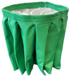
MTF Filtro teflonato (Classe M EN 60335-2-69)