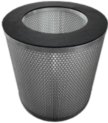
HEPA 14 Filtro assoluto (EN 1822) 110.000 cm 2 superficie filtrante Classe H14 (EN 1822) Fibra di vetro