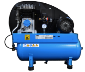
COM Compressore a bordo Compressore montato su carenatura posteriore