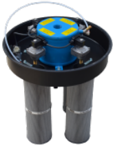
SP Pulizia cartucce in controcorrente d'aria Filtro antistatico classe M (EN 60335-2-69) 4 Filtri poliestere antistatici 12 m 2 superficie filtrante