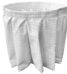
ANT M Filtro antistatico (Classe M EN 60335-2-69)