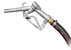
TUBO CON PISTOLA DI SCARICO

Cartuccia antiolio per protezione del motore