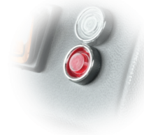
SPIA DI INTASAMENTO FILTRO

Robusta costruzione in acciaio verniciato industriale