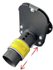
REGOLATORE DI PORTATA D'ARIA