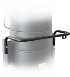
ASA DE EMPUJE