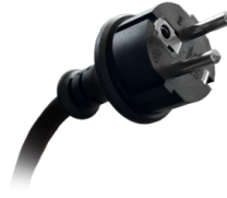
ENCHUFE TIPO SHUKO