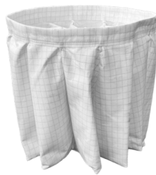
ANT M Antistatischer Filter (M Klasse EN 60335-2-69)