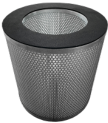
HEPA 14 Absolutfilter (EN 1822) 110.000 cm 2 Filterfläche Antistatischer H14 Klasse Filter (EN 1822) Glasfaser