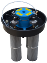
SP Druckluftabreinigung Antistatischer M Klasse Filter (EN 60335-2-69), 4 Polyester Filterpatrone, 12 m 2 Filterfläche