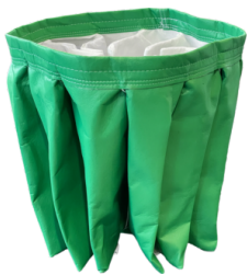
MTF Teflon Filter (M Klasse EN 60335-2-69)