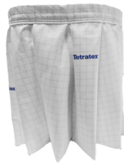
PTFE ANT Antistatischer PTFE Filter (M Klasse EN 60335-2-69)