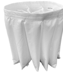
PTFE PTFE Filter (M Klasse EN 60335-2-69)