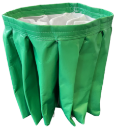
MTF Filtru de teflon (clasa M EN 60335-2-69)