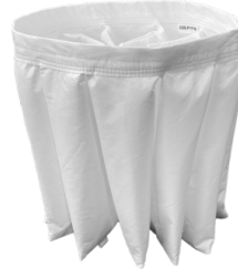
PTFE Filtru PTFE (clasa M EN 60335-2-69)