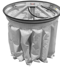
PSC Agitator cu filtru pneumatic semi-automat