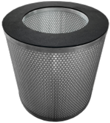
HEPA 14 Filtru absolut (EN 1822) 110.000 cm 2 filter surface H14 Class Filter (EN 1822) Glass fiber