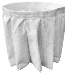
ANT M Filtru antistatic (clasa M EN 60335-2-69)