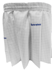
PTFE ANT Filtru antistatic PTFE (clasa M EN 60335-2-69)