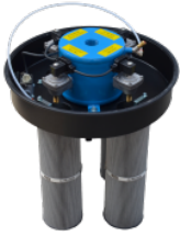
SP Sistem de curățare a filtrului cu jet invers