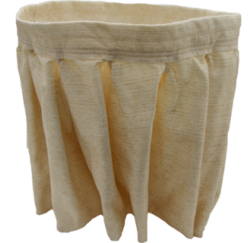
NOMEX Filtru rezistent la 250 ° Celsius