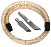
P12352 KIT HUILE ET COPEAUX Kit complet d'accessoires spécifiques pour l'application d'aspiration d'huile et de copeaux de 50 mm de diamètre