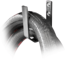
CROCHET POUR TUYAU