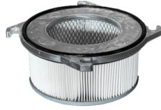
CARTOUCHE D'HUILE Cartouche anti-huile pour la protection du moteur