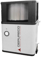
POST H Post-Cartouche