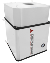
PRE H Pre-Cartouche